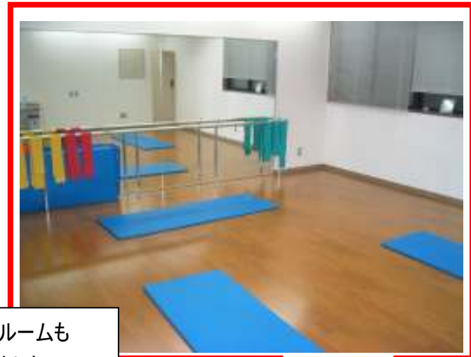
アスレチックルームも 新しくなりました。