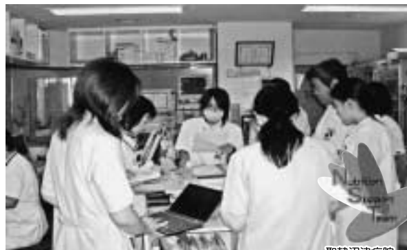
病棟でのカンファレンス風景