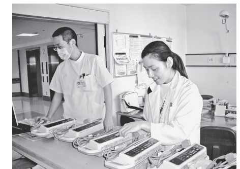
(文責 ME室 杉本 恵理)

私たち「臨床工学技士」は患者様の治療がスムーズに進むよう、全力でサポートさせていただきます。