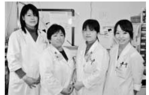
認定臨床エンブリオロジスト1名を含む4名の臨床検査技師