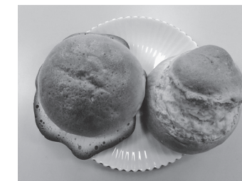
【変わらぬうまさのUFOパン】と 【人気急上昇中の甘食】